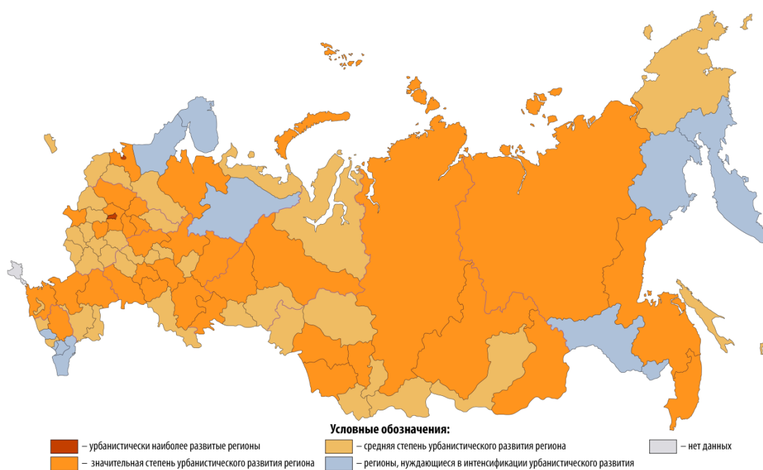
Рисунок 3. Классификация регионов РФ по уровню развития урбанистических процессов, 2005 г.