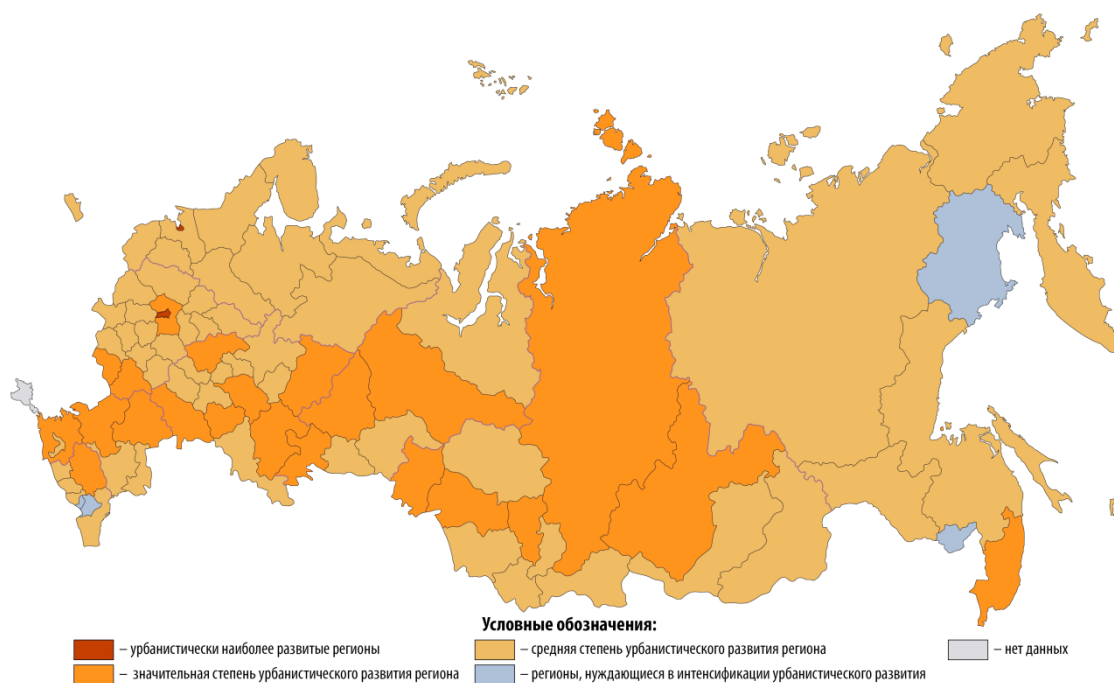
Рисунок 4. Классификация регионов РФ по уровню развития урбанистических процессов, 2015 г.