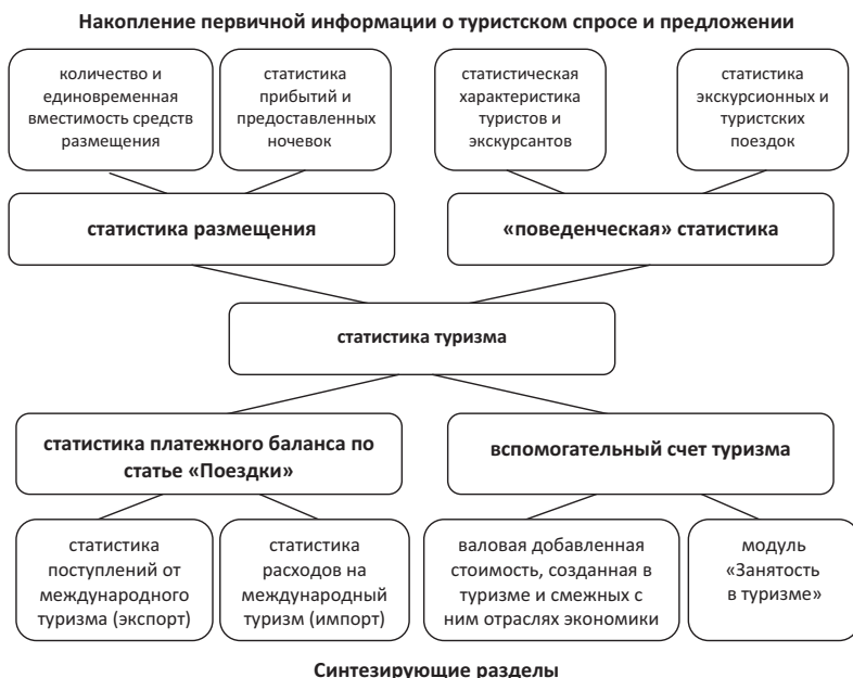
Рис. 1. Отраслевая структура статистики туризма