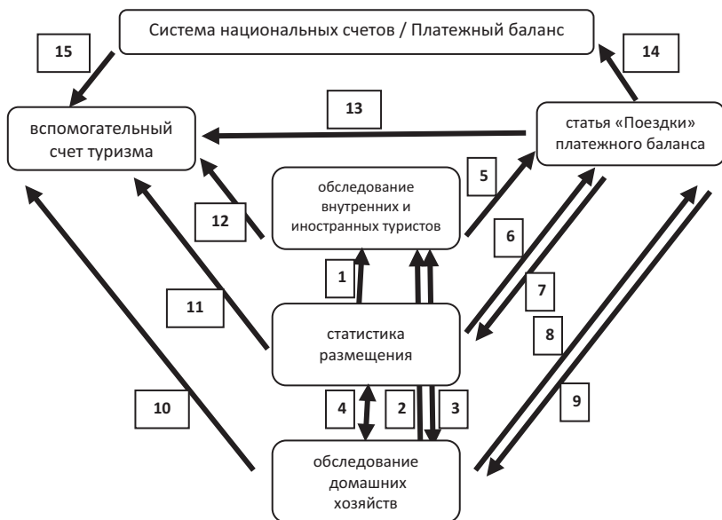
Рис. 2. Интегрированная система статистики туризма

Цифрами на рисунке обозначены: 1 — данные о ночевках для определения выборки респондентов, согласование содержания анкет для опросов; 2 — информация о посещениях родственников и знакомых; 3 — согласование содержания анкет для опросов; 4 — перекрестная проверка достоверности результатов статистического наблюдения; 5 — данные о средних ежедневных расходах туристов-нерезидентов в средствах размещения; 6 — данные о ночевках туристов-нерезидентов в средствах размещения с разбивкой по странам происхождения; 7 — подробная разбивка информации об экспорте туристских услуг по географическому признаку; 8 — данные о расходах резидентов в поездках на отдых и с деловыми целями; 9 — подробная разбивка информации об импорте туристских услуг по географическому признаку, проверка достоверности сведений посредством данных по кредитным карточкам; 10 — сведения о расходах резидентов на внутренний туризм, информация о выездном туризме для построения таблицы № 3 вспомогательного счета туризма; 11 — данные о количестве ночевков туристов с территориальной разбивкой и категориям отелей; 12 — информация о структуре расходов посетителей; 13 — данные для определения объемов поступлений от туризма; 14 — таблицы увязки данных для определения объемов потребительских расходов населения, величины расходов на деловые поездки как производственных затрат; 15 — информация, содержащаяся в таблицах «затраты-выпуск».