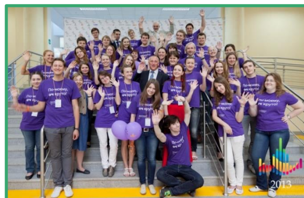
Оргкомитет ОЧ 2013 и председатель Жюри А.А. Аузан