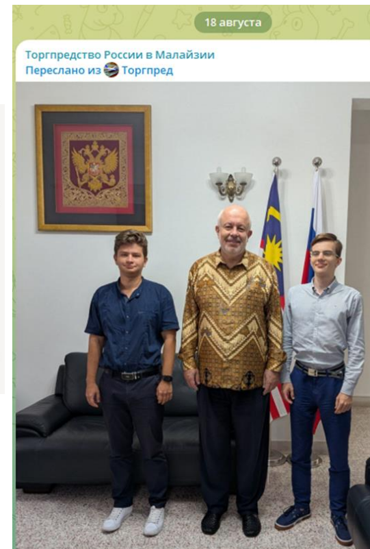
С 1 по 15 августа 2025 года студенты 3 курса бакалавриата МГУ, обучающиеся по направлению подготовки «Менеджмент», прошли производственную практику в Торговом представительстве Российской Федерации в Малайзии. Студенты изучили особенности работы Торгового представительства, приобрели необходимые навыки подготовки справочных материалов, а также новые знания о культуре и обычаях страны.

Торговое представительство – государственный орган в составе российской дипломатической миссии, обеспечивающий содействие развитию двустороннего торгово-экономического, инвестиционного и межрегионального сотрудничества.