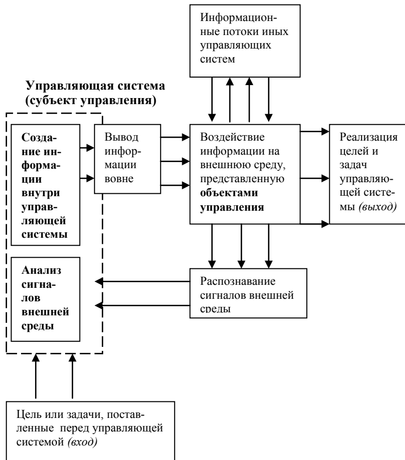
Рис. 2. Схема работы с информацией в новом менеджменте

Как правило, под внутренней средой предприятия понимают все то, на что его менеджмент может оказывать влияние, а под внешней средой — то, что ему не доступно. Традиционные методы анализа внешней среды (типа STEP, SWOT или разного рода управленческий анализ) рассматривают ее как источник неуправляемых возможностей и угроз. Однако любой руководитель всегда старается расширить внутреннюю среду своей управляемой системы до максимальных границ. В новой экономике и менеджменте эта проблема решается через использование ряда стратегий. Приведем три основных.