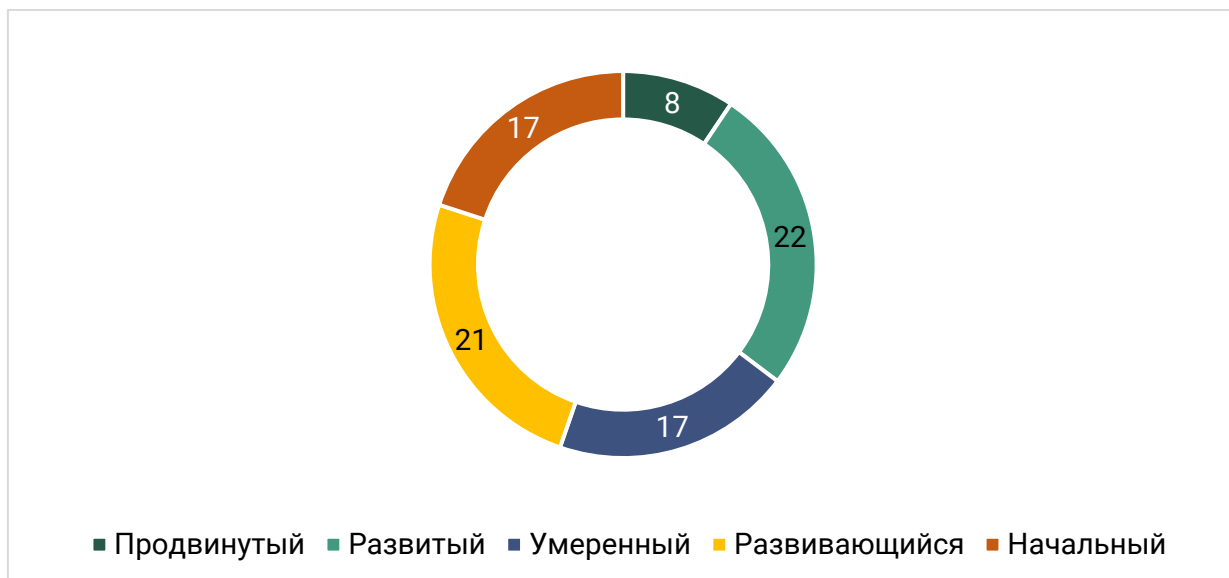
Рисунок 2. Разделение 85 регионов по уровню устойчивости развития туризма и гостеприимства в 2023 году

Лучшими практиками в сфере устойчивого развития туризма и индустрии гостеприимства можно назвать опыт 8 регионов (годом ранее таких регионов было всего 5), отнесенных на основе значений интегрального индекса к «продвинутому» уровню. Однако необходимо иметь в виду, что «продвинутыми» регионы являются относительно других, и даже регионам этого уровня следует продолжать работу по внедрению принципов устойчивого развития в индустрии туризма и гостеприимства.