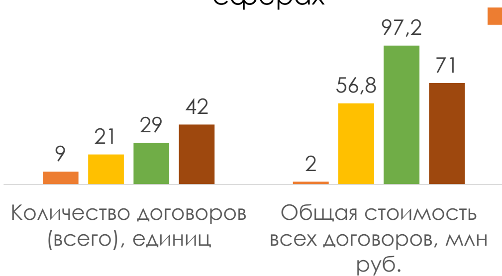
Динамика количества и стоимости договоров в научной и консалтинговых сферах