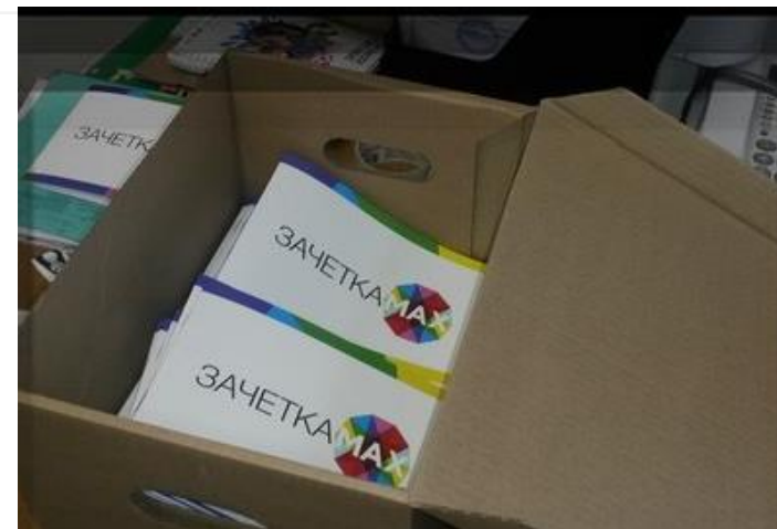
Зачетки «МАХ» выдаются участникам в 1-ом семестре